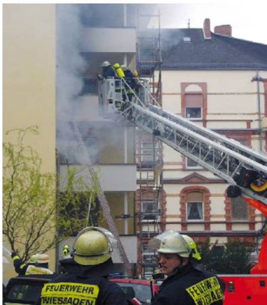
фото: пожарная Wiesbaden

ПДИ не предотвращают пожаров, но они реагируют на дым и своевременно извещают Вас громким сигналом.